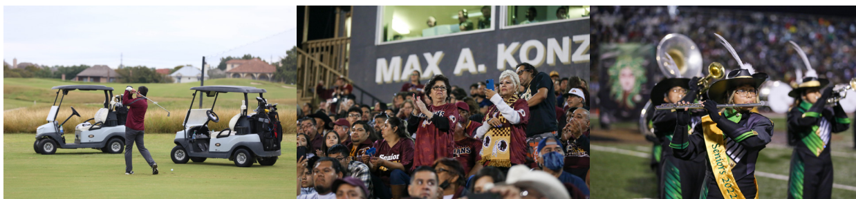
Pictured left to right: Harlandale Education Foundation hosts its annual golf tournament, hundreds of fans, families, and students show up for the Frontier Bowl which returned to Memorial Stadium this year.